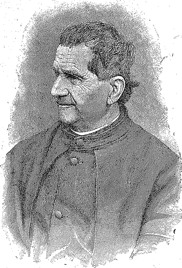
Venerabilis Joannes Bosco